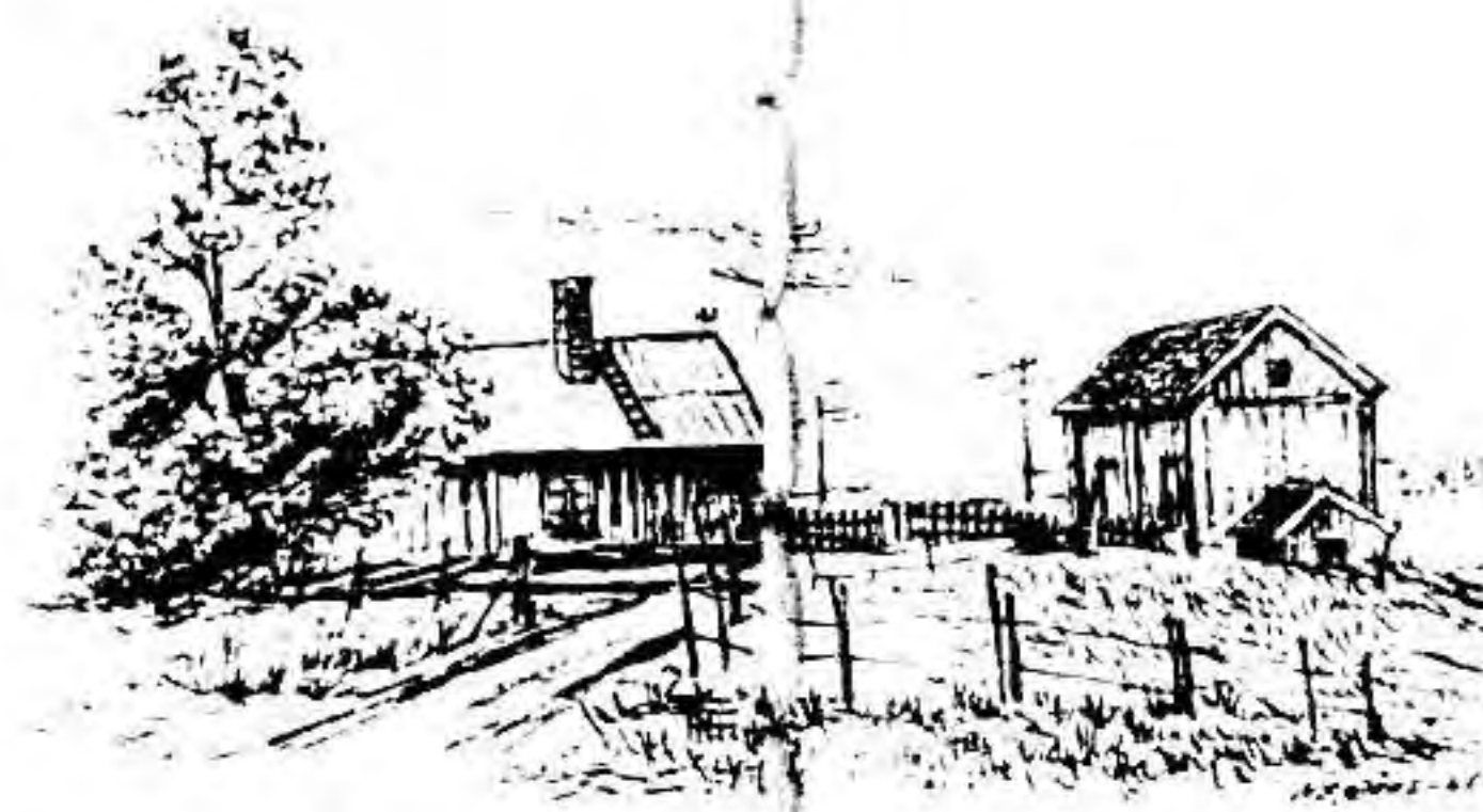
Barndomshemmet i Ålvikaleby (från norr).

Bilden t. v.: Spiselvrån i barndomshemmet, där farmodern, en märkelig kvinna, skötte kosthållet. "Genom farmodern fick Stig Dagerman för första gången en förställning om vad absolut kvalitet vill säga", skrev Olof Lagercrantz i sin Dagerman-biografi. "Det var en sporre som aldrig upphörde att verka."